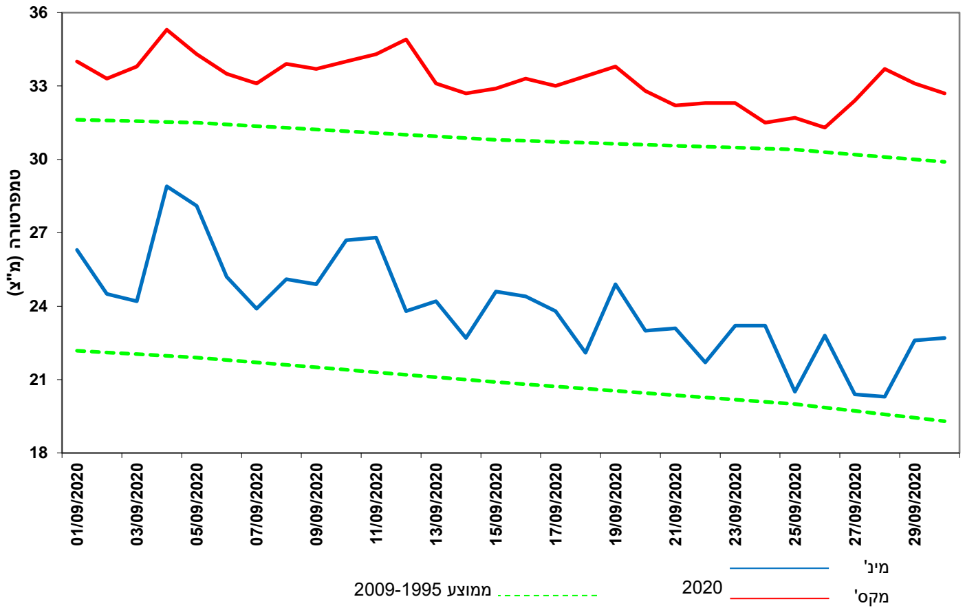
איור 2: טמפרטורת המינימום והמקסימום היומית בבית דגן באוגוסט 2020 לעומת הממוצע הרב שנתי